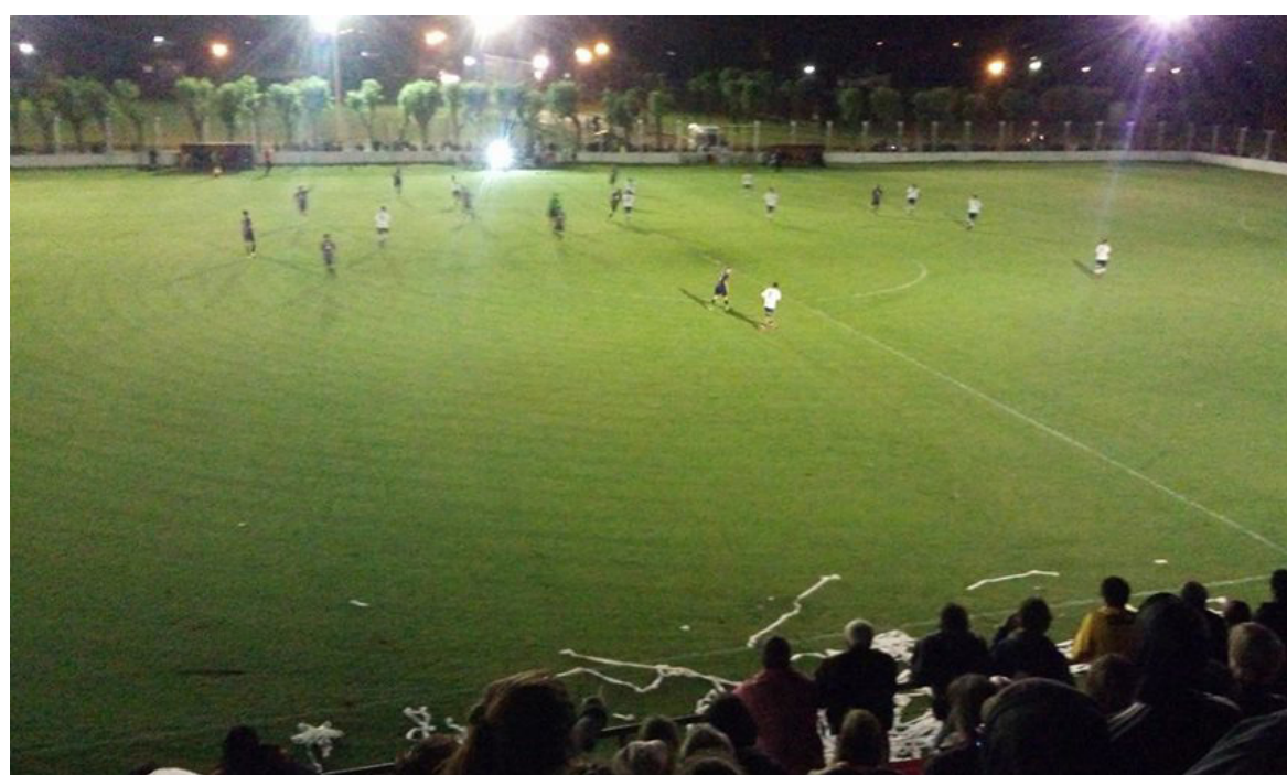
Belgrano vs Sp. Rivadavia